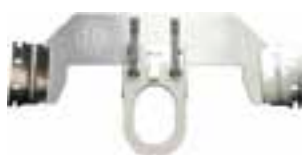
telaio per calzini