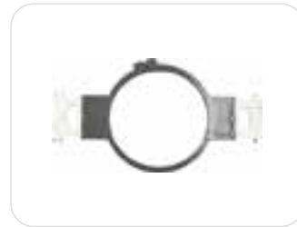
1 x telaio rotondo 12cm