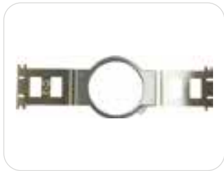
1 x telaio rotondo 20cm