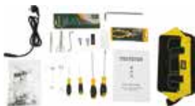
kit di strumenti

Kit di strumenti Manuale operativo Tavolo e supporto con ruote Bobinatore