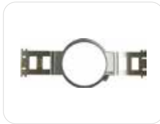
1 x telaio rotondo 15cm