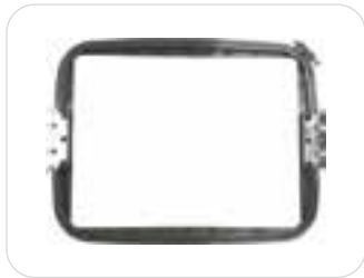
1 x telaio rettangolare 32x24cm